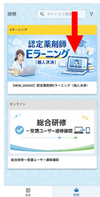
【Eラーニングの場合】